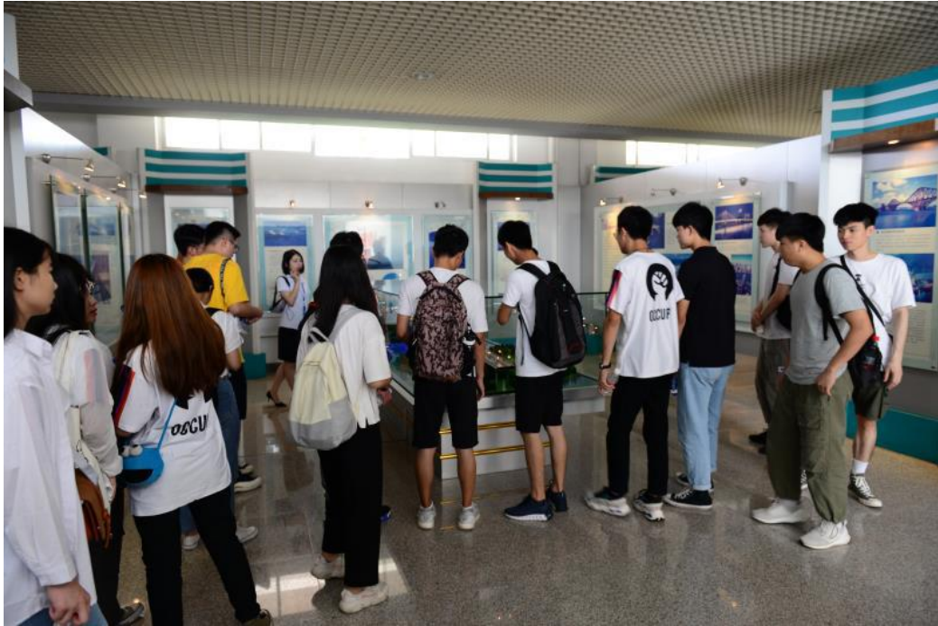
（学生参观桥梁博物馆桥梁沙盘）

桥梁科普讲座邀请了广东省交通规划设计研究院股份有限公司副总工程师教授级高工孙向东，作题为“桥梁史话与发展”讲座。以公路桥梁发展近现代史和科技创新前景为主线，从桥梁建造的材料演变，到结构设计的创新，把桥梁的结构体系、受力特点、建筑材料、施工工艺、造型艺术、发展趋势等方面娓娓道来。同学们跟随着孙总工的讲述展现不同时代、不同材料、不同结构的桥梁风采，以自身从事公路工程设计 20 多年、几十项重大公路工程建设为背景，教导同学们要认真刻苦学习、不断发奋进取，为同学们提供了一场精彩纷呈的桥梁科普文化大餐。