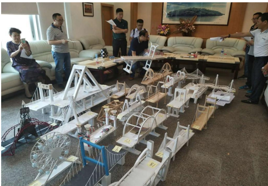
（对广东交通职业技术学院桥梁设计大赛评选）

在此次活动中，广东交通职业技术学院同时开展了第四届“桥博杯”桥梁模型创意大赛评奖活动，将参赛的优秀作品带到了广东桥梁博物馆展出，并利用科普活动现场的专家和教师给予点评、评选设计大赛获奖作品，增加了同学们的获得感、丰富了科普活动内容。