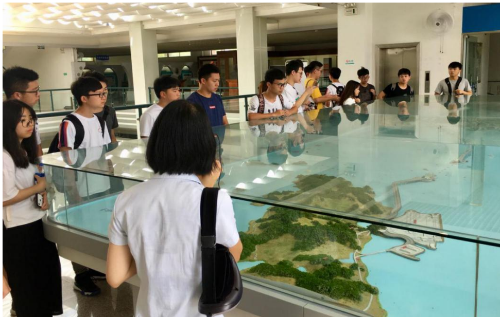
(同学们驻足在港珠澳大桥沙盘前，感受世纪工程的雄伟)

在桥博馆讲解员的引领下，同学们参观各个展区，一边观看馆藏中的图片、文字、模型、电教等，一边聆听讲解员精彩的讲解，感受广东桥梁建设历程，凝视大桥建造者的雕塑和一些实物，体现桥梁文化和科技魅力，领略工程建造者的辛劳和伟大。