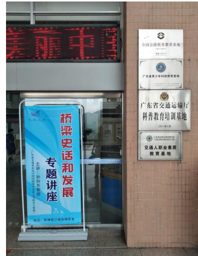
（“桥梁史话与发展”讲座科普讲座现场）

在此次活动中，广东交通职业技术学院同时开展了第四届“桥博杯”桥梁模型创意大赛评奖活动，将参赛的优秀作品带到了广东桥梁博物馆展出，并利用科普活动现场的专家和教师给予点评、评选设计大赛获奖作品，增加了同学们的获得感、丰富了科普活动内容。